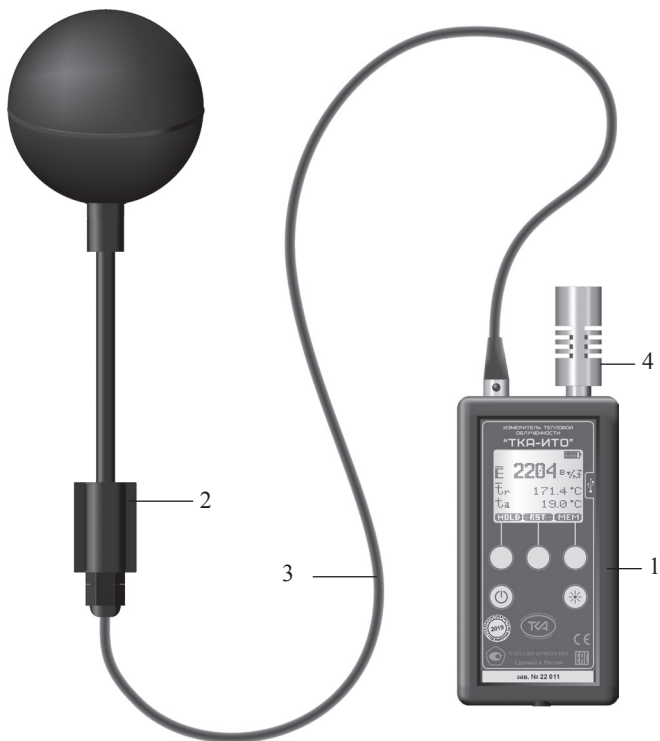
Рис.1 – Внешний вид прибора “ТКА-ИТО”.